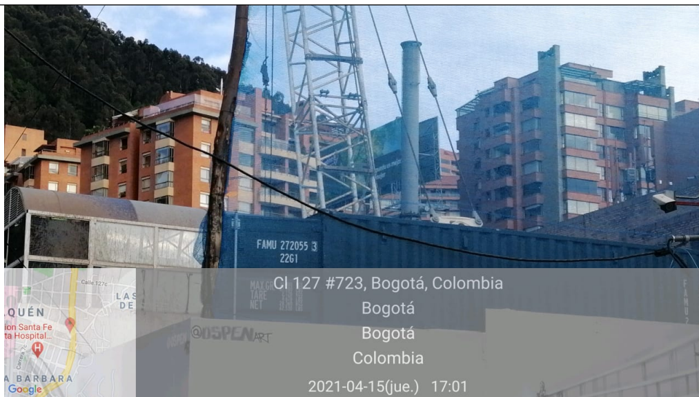
Foto 2. Vista del mástil tubular de la valla el cual continúa instalado, sin embargo, los paneles y la estructura superior fueron desmontados.

Foto 1. Vista panorámica del predio ubicado en la Av. Calle 127 No. 7-39 (dirección catastral), donde se evidencia que la estructura y paneles de la valla fueron desmontados.